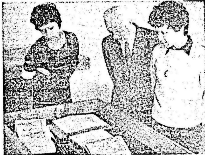
Aspect din expoziția „Arta ilustrației de carte” deschisă la Biblioteca județeană Arad.

Desfășurându-se în cea de-a doua zi pe trei secțiuni („Muzeu, arhive și bibliotecă din țară și din străinătate despre Arad”, „Probleme actuale ale ocrotirii conservării și restaurării patrimoniului cultural național”, „Probleme de istorie și metodica predării istoriei”) și având un mare număr de lucrări datorate altor invitați cît și cercetătorilor locali, sesiunea și-a adus o valoroasă contribuție la aprofundarea științifică a unor importante momente din istoria noastră națională, reliefând aspecte ale culturii materiale și spirituale de pe teritoriul arădean, de conservare, ocrotire și restaurare a vestigiilor acestui trecut.