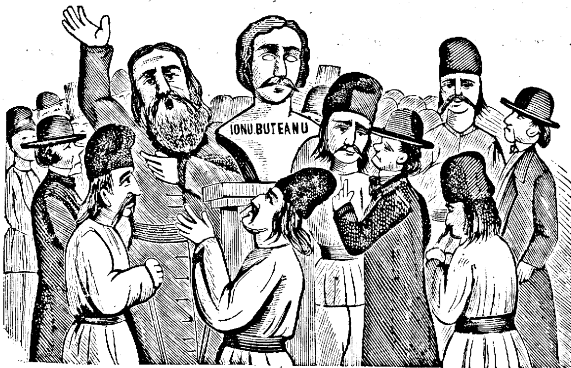
Dincóce de Carpati.

Proprietariu, redactoru respundiatoriu si editoru : Iosifu Vulcanu.