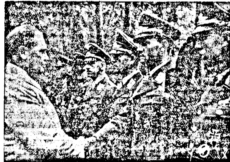
Reichsmareșalul Herman Göring dă mâna cu ofițerii cari s'au remarcat în lupte.

De deasupra dealului Rășcanu, soarele își ridică aureola, până în tările cerului.