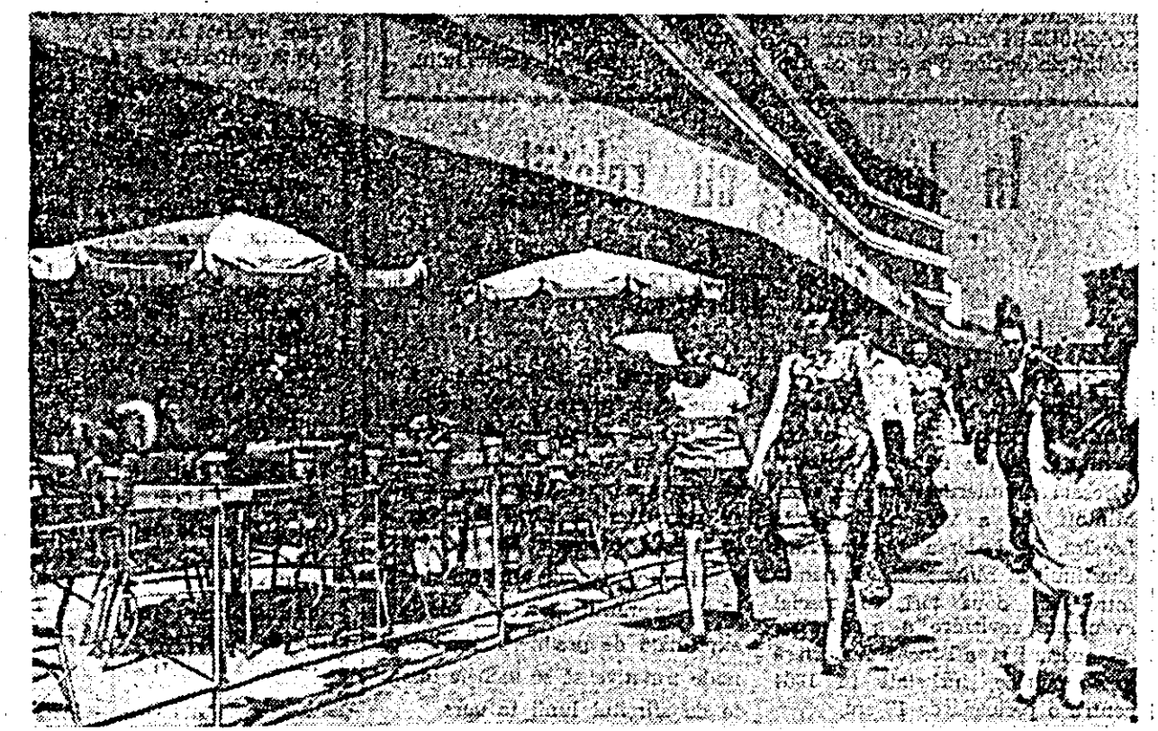
Vedere din noua piață a gării.