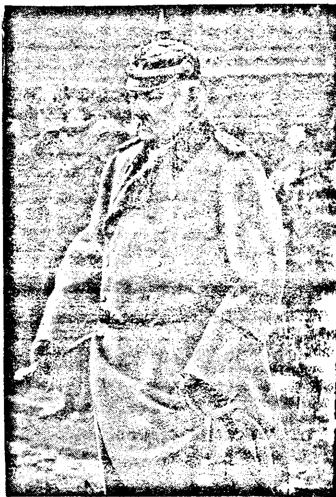
Reichspräsident von Hindenburg feiert heute, am 2. Oktober seinen 86. Geburtstag.

Der Tarif, nach welchem die Hilfslehrer bezahlt werden, wurde wie folgt festgesetzt: 1700 Lei monatlich in den Städten der ersten drei Kategorien, 1500 Lei für die anderen Städte, 1200 Lei für die Dörfer.