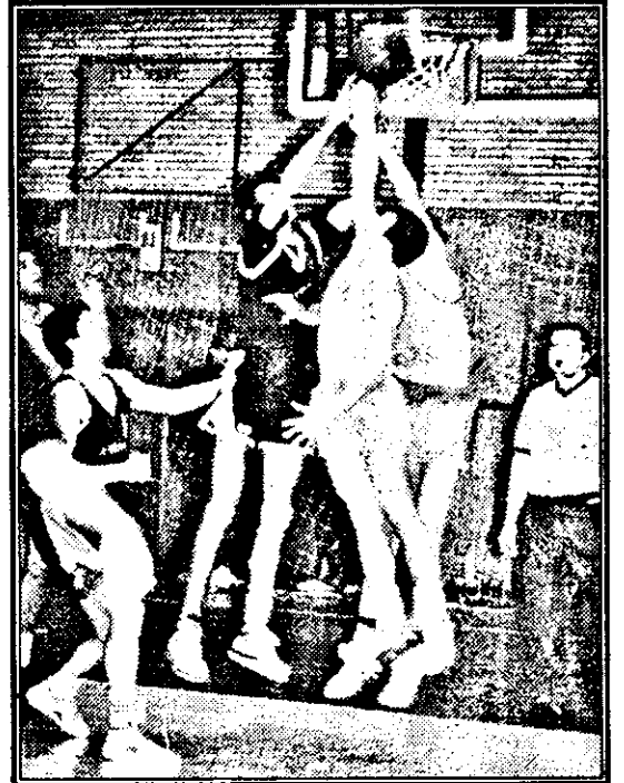
Un buchet de jucători arădeni și bucureșteni luptă fără menajamente pentru balon, sub privirile atente ale arbitrilor I. Olaru.

În întâlnirea de ieri, condusă de același cuplu de arbitri, tot bucureștenii vor fi cei care vor debuta de dreptul, conducând, după minutele de încălzire, cu 15-9. Arădenii, prompti, egalează (15-15) în urma unor contraatacuri spectaculoase finalizate de Spătar și preiau conducerea (24-17). Se părea că vom fi martorii unui meci aproape identic cu cel de sâmbătă, dar ne vom înșela, deoarece studenții din capitală nu vor permite baschetbaliștilor noștri să se