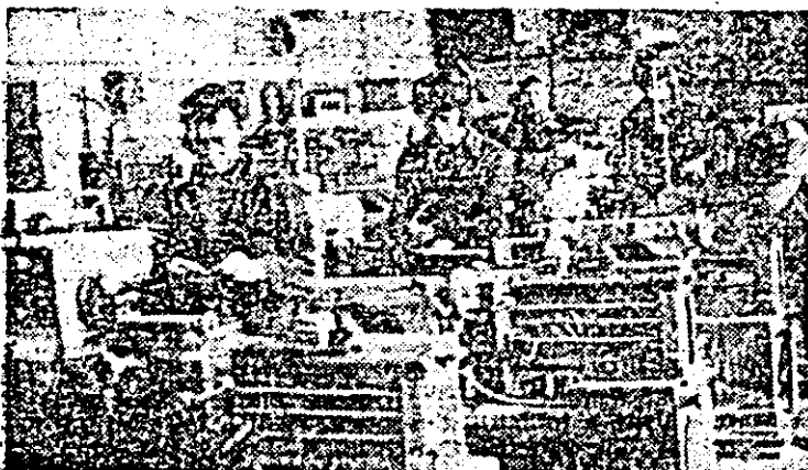
Aspect de muncă în secția montaj a întreprinderii de mașini-unelte Arad.