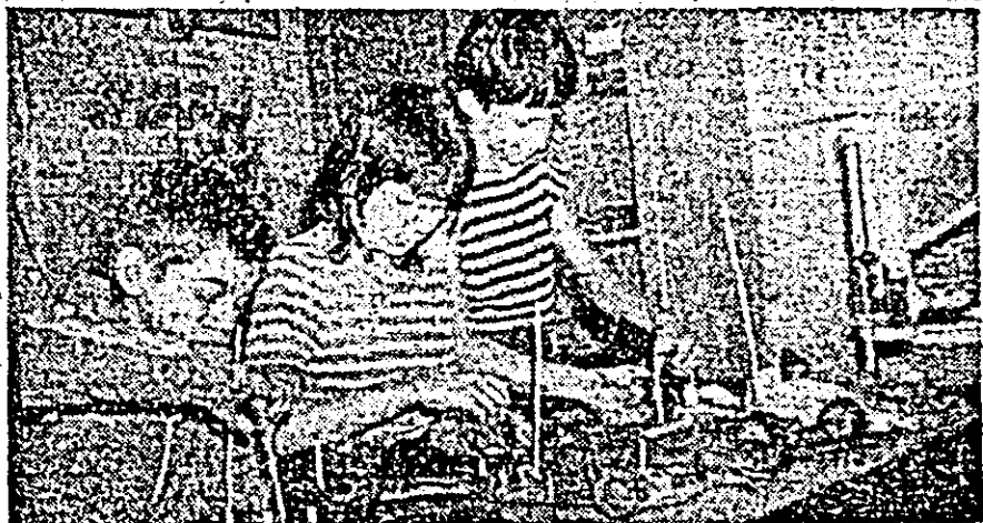
Aspect din activitatea cercului de automobile al Casei pionierilor și soldurilor patriei Arad.