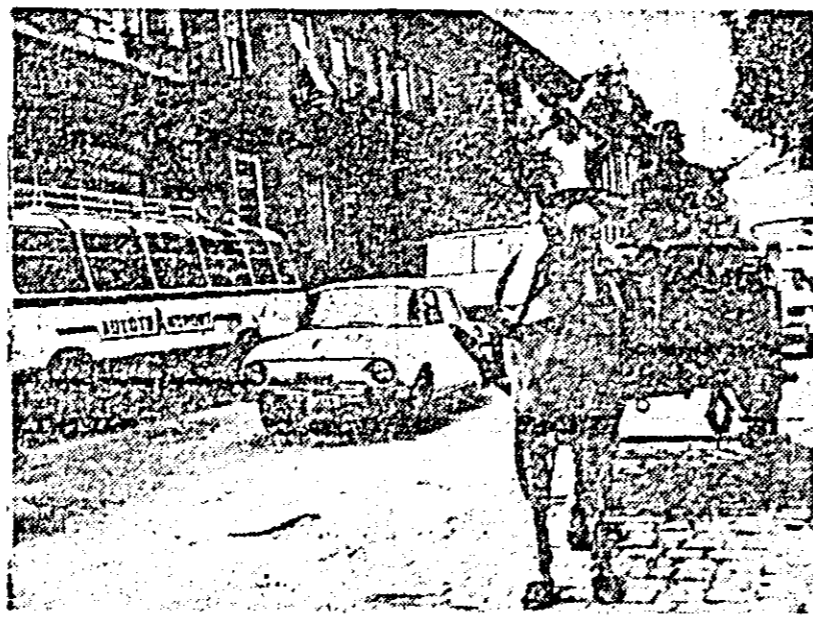
Nou şi vechi...