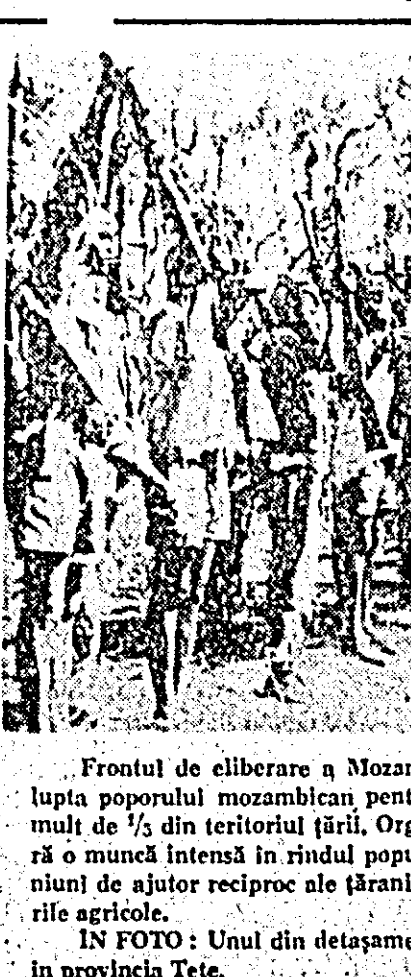
Frontul de eliberare a Mozambicului FRELIMO, care conduce lupta poporului mozambican pentru eliberarea sa, controlează mai mult de 1/3 din teritoriul țării. Organe ale puterii populare desfășoară o muncă intensă în rândul populației, creând școli, cooperative, uniuni de ajutor reciproc ale țăranilor, puncte medicale, conduc lucrările agricole.

impotriva Laosului și folosirea aviației militare americane împotriva acestor țări”. Aceste acțiuni riscă să provoace extinderea unui război dintre cele mai ucigătoare în Laos, amenințând astfel serios pacea în Indochina și în sud-estul Asiei. În telegrama menționată se cere adoptarea unor măsuri energice, eficace și urgente care să-i oblige pe agresori să respecte acordurile de la Geneva din 1962 privitoare la Laos