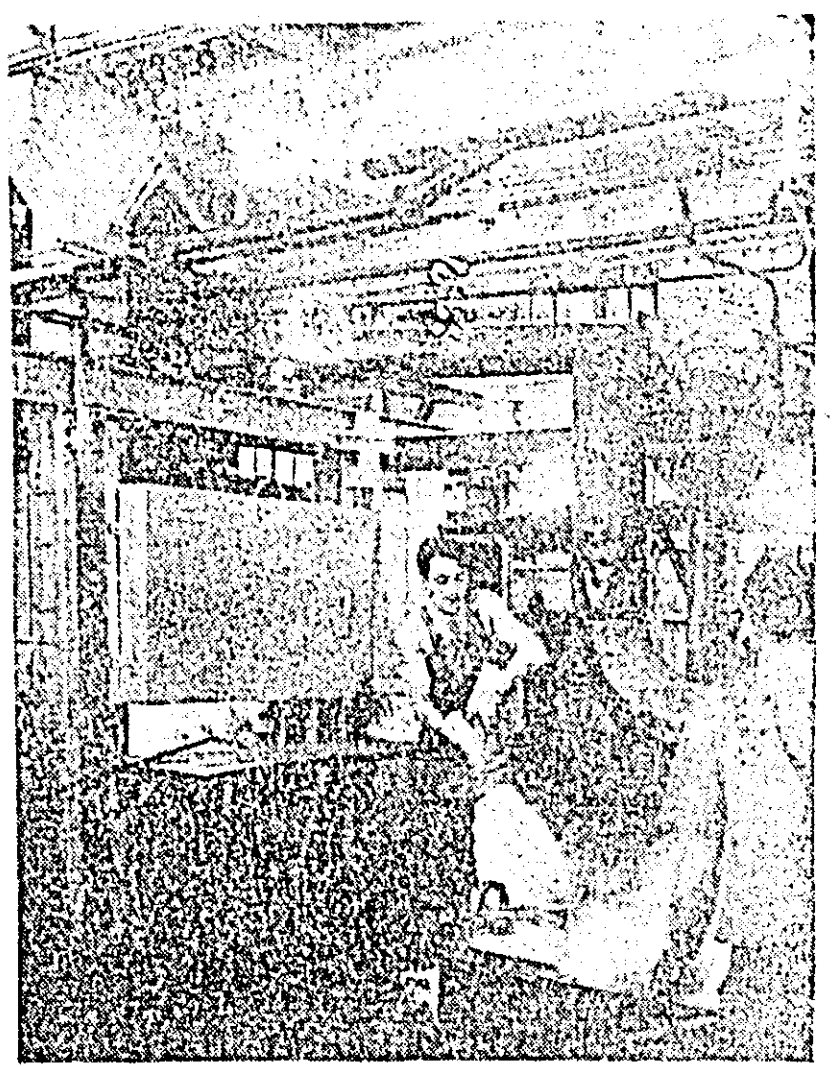
Secția arcuri de la Uzinele de vagoane își aduce o contribuție substanțială la realizarea unor subsansamble de calitate. IN CLISEU: aspect din secția amintită.