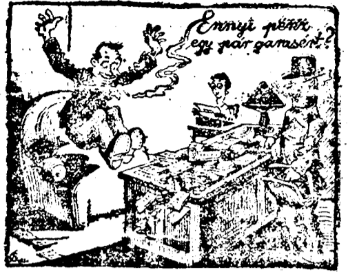
Rendeljen meg ma

Londonból jelentik: Ghandi elismerően nyilatkozott a kormányról, amely nem akadályozta meg zarándokutját. Ezzel lezárult a nagy munka első fejezete. Isten segítségével — mondotta Ghandi — holnap reggel hét órakor megkezdjük a tényleges ellenállást, mert április 6-ika nagy ünnepünk, a nemzeti bünbánat és megtisztulás napja. Mindenki bőjtöl ezen a napon és imával készíti elő a lelkét a nagy nemzeti munkára. Hétezer ember ajánlkozott arra, hogy megakadályozza a vasúti közlekedést, ha másképp nem, azzal, hogy a vonatok elé fekszenek. A nép elhatározta, hogy a rendőrbetők ellen foglalkal védekeznek. A mai napon újabb letartóztatások történtek.