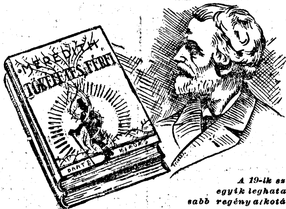
A 19-ik század egyik leghatározottabb regényalkotása a

Elsőrendű uri szabóság. Angol szövetségkülönlegességek.