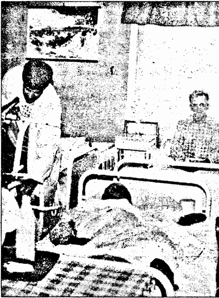
Pe patul de spital, suferința bolii este completată în mod nefericit de convingerea guvernului că din numai 1750 lei pe zi i se pot asigura bolnavului trei mese.

Un pacient, când este internat într-un spital, beneficiază de gratuitate, dacă face dovada că are acest drept. Dacă nu, EA trebuie plătită. O zi de spitalizare costă între 20.000 și 200.000 lei și în unele cazuri chiar mai mult, în funcție de tratamentul și medicația administrate. Desigur, oricând pacient este internat, dar la externare se mai întâmplă să se înmăneze și nota de plată.