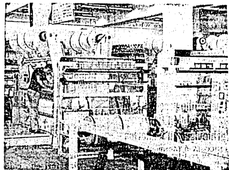
Aspect din secția rachel a întreprinderii „Tricoul roșu”, secție în care muncitorii harnici și pricepuți realizează produse mult apreciate de beneficiari.