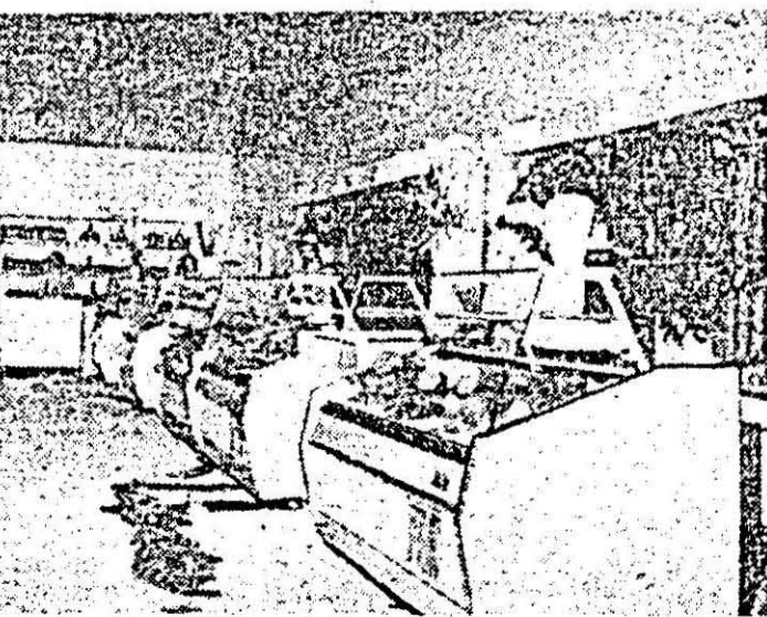
Aspect din noul magazin al complexului comercial I.A.S., deschis recent în strada Ecaterina Varga din municipiul nostru.