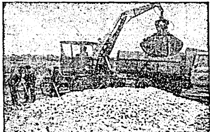
La C.A.P. Zimandu Nou se lucrează la transportul porumbului.

● Toată suflarea satelor să se afle în cîmp la recoltarea grabnică a porumbului și legumelor!