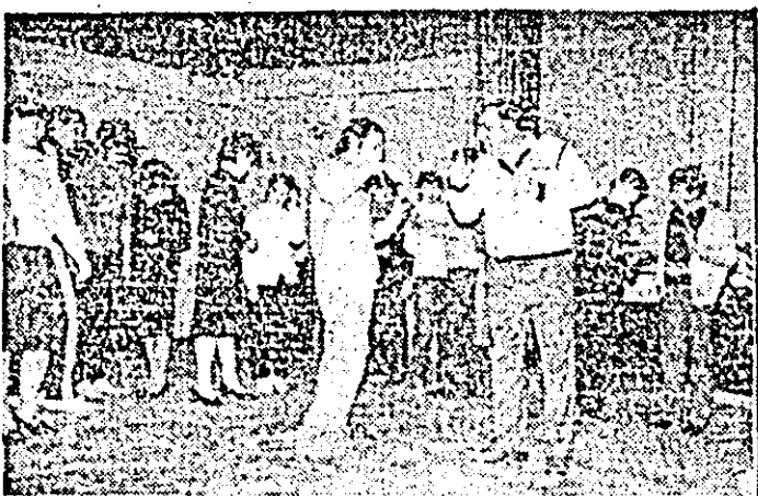
Aspect din timpul unei repetiții generale pe scena Casei orășenești de cultură din Nădlac.