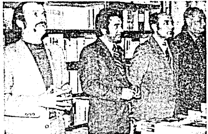
Instantaneu din timpul prezentării noului roman.