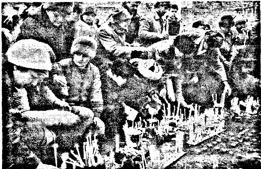
Zilnic în Piața primăriei sute de oameni aprind lumânări în memoria martirilor.