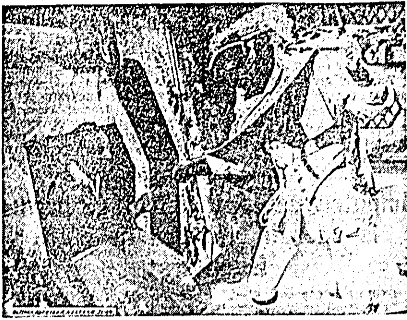
În clipă: O scenă din film

ma dată teoriile lui căldite pe fundamentul gubred al sacului cu bani au întipărit o rezistență dîră. Pentru prima dată aici a găsit oameni pe care nu-i poate cumpăra cu bani pentru a-și satisface capriciile sale.