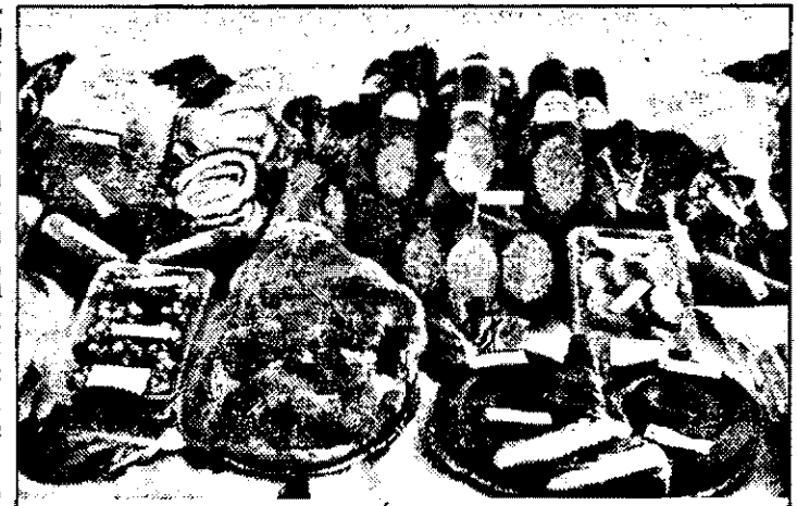
Chiar dacă sunt la fel de aspectuoase și bune ca produsele de „afară” mezelurile românești nu le pot bate pe cele străine din cauza prețului generat de costurile de producție...