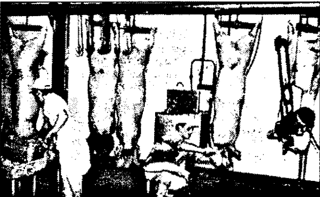
Politica falimentară dusă de actualii guvernanți va pune și industria cărnii românești pe butuci...

Revoluție când s-a format patronatul RO-CARNE, pe scheletul fostei centrale a cărnii. Dacă s-ar forma un comitet al producătorilor de carne, cu reprezentanți din teritoriul altfel ar fi apărute interesele acestora. Acum, cei din patronat sunt miticii care țin doar la posturile lor, neavând interes să-l ajute cu adevărat pe producătorii din provincie”, a precizat sursa citată.