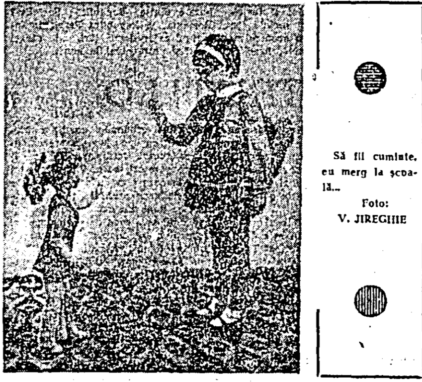
Să fii cuminte, eu merg la școală...

În vederea satisfacerii în condiții cât mai bune a necesităților cumpărătorilor, Direcția comercială a introdus orarul fără pauză la un însemnat număr de magazine cu profil industrial. Vor funcționa cu program între orele 8—20 următoarele unități: Universal-Aradul, Cristal (gară), Record, Durabil (gară), Terecot (gară), Automoto și Electroacustică, Menajul, Modern, Pionierul.