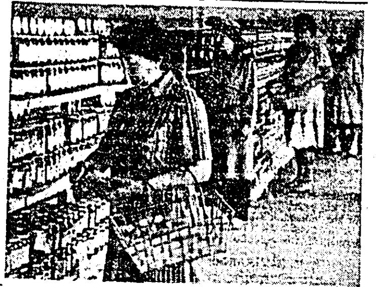
Aspect din magazinul alimentar cu autoserviciu din Piața Mihai Viteazul.