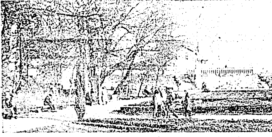
Primăvara văzută prin obiectivul fotografic al colaboratorului nostru Al. Marlanuț.

Ieri, 27 martie a.c., la clubul presei din Arad, sub egida Consiliului județean Arad al Organizației pionierilor, purtătorii cravatei roșii-cu tricolor de la Casa pionierilor și soimilor patriei din Sîntana, au deschis o interesantă expoziție de pictură. La vernisaj au participat, alături de expozații, pionierii de la Școala generală nr. 13 din Arad. Acțiunea s-a bucurat de un frumos succes.