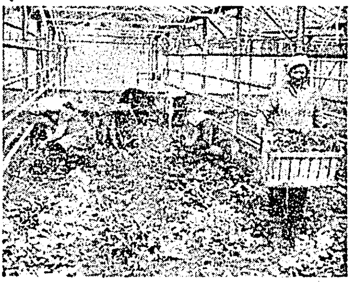
— Timpul bun de lucru îl îndeamnă pe legumicultorii să scoală cât mai repede răsădirile pentru a le planta în cîmp.

De acum, atenția colectivului de muncă de la această stațiune se îndreaptă spre însămînțatul culturilor de mai mare pondere și importanță: porumbul și soia care vor ocupa în total 1200 hectare. Pe măsură ce în sol temperatura va crește, chiar în cursul săptămînii viitoare, se va trece la însămînțatul porumbului furajer pe suprafața de 300 hectare, totul fiind pregătît pentru a se da startul la această cultură. S-au creat condiții bune de producție la aceste culturi întrucît au fost transportate în cîmp peste 2000 tone gunoi de grajd și de păsări de la I.S. „Avicola”.