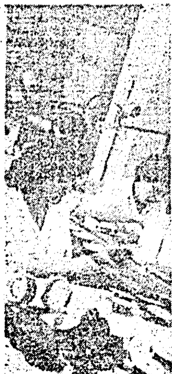
Aspect de muncă la linia I montaj a întreprinderii de ceasornice „Victoria”.