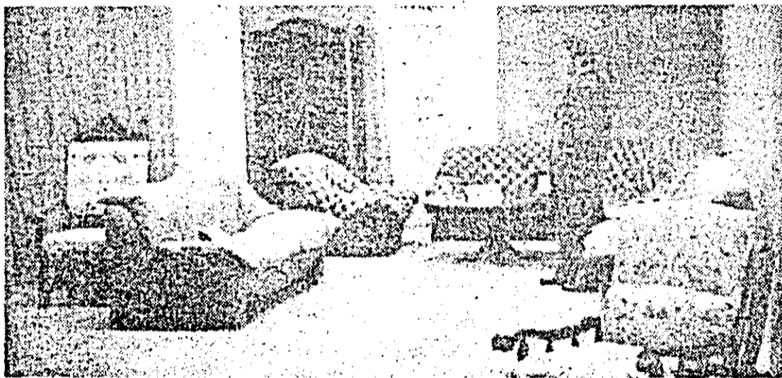
Aspect din expoziția permanentă a C.P.L. Arad.

tivitatea în acest domeniu, orientările și indicațiile conducerii partidului privind înfăptuirea unei agriculturi intensive. Important este ca lectorii să urmărească temeinic instruirea cursanților și aplicarea practică în câmp, sere, adăposturi de animale, ateliere, a tehnologiilor în vederea însușirii lor în bune condiții. Din experiența rodnică a unităților agricole frunzate ale județului nostru, cum sînt cooperativele agricole „Ogorul”, „Steagul roșu” Pecica, „Măceș”, I.A.S. Semlac și altele rezultă că loturile demonstrative organizate la principalele culturi au un rol însemnat în stabilirea celor mai productive soiuri. De aceea, în cadrul cercurilor de învățămînt agrozootehnic se va urmări extinderea în fiecare fermă a loturilor demonstrative în vederea aprofundării cunoștințelor teoretice, a introducerii în cultură a celor mai valoroase soiuri de plante care să asigure rezultate bune în aplicarea tehnologiilor la culturile intensive de grâu, orz, porumb, sfeclă de zahăr, cartofi, sau legume. Odată cu aceasta să se dezbate pe larg activitatea din ferme, reducerea consumului de materiale, energie și combustibil, creșterea productivității muncii, înfăptuirea principilor noului mecanism economic-financiar. În cadrul învățămîntului este indicat să se promoveze o diversitate mai mare de forme de instruire: ca: expuneri, dezbateri, schimburi de experiență, demonstrații practice, calcule economice, prezentări de filme și diafilme etc.