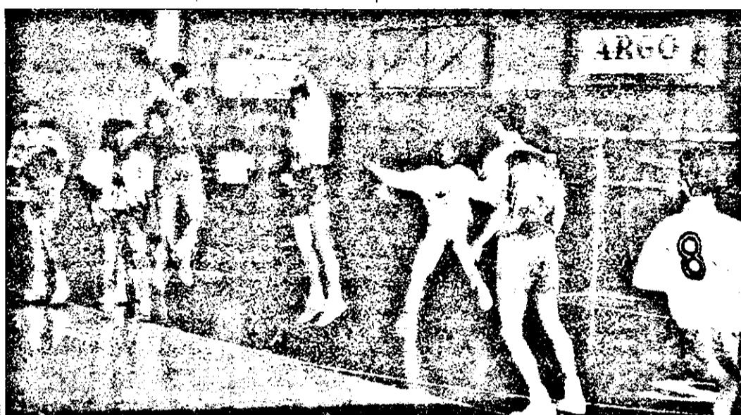
Acțiunea lui Dedu (Steaua) parată de apărarea arădcană.