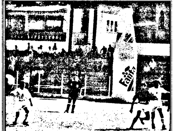
Secvență din meciul UTA - Liceul Sportiv Oradea 1-2, din cadrul Cupei Coca-Cola, la fotbal.

Au arbitrat: M.Axente-jr.(centru), L.Țandără și Gh.Petrișor. Astăzi au loc ultimele meciuri din grupe, din cadrul turneului final al