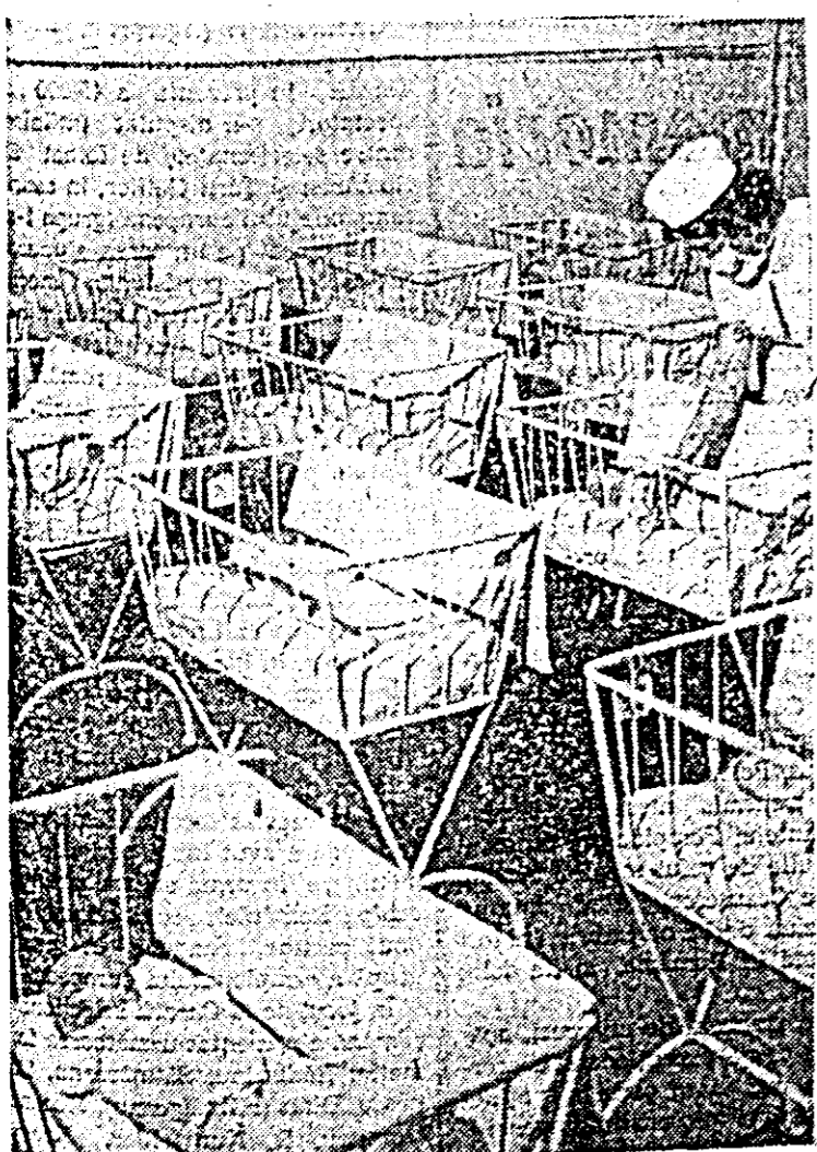
O imagine elocventă de la Spitalul matern din Arad, asupra condițiilor create noilor născuți.

O tot mai mare însemnătate capătă sistematizarea localităților rurale, care va duce neîmîncat la formarea unor centre economice puternice. În felul acesta în scurt timp se va ajunge la o creștere rapidă a gradului de civilizație al oamenilor, se va micșora continuu diferența care există încă între sat și oraș.