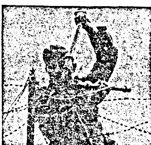
În fața sârmelor ghimpate