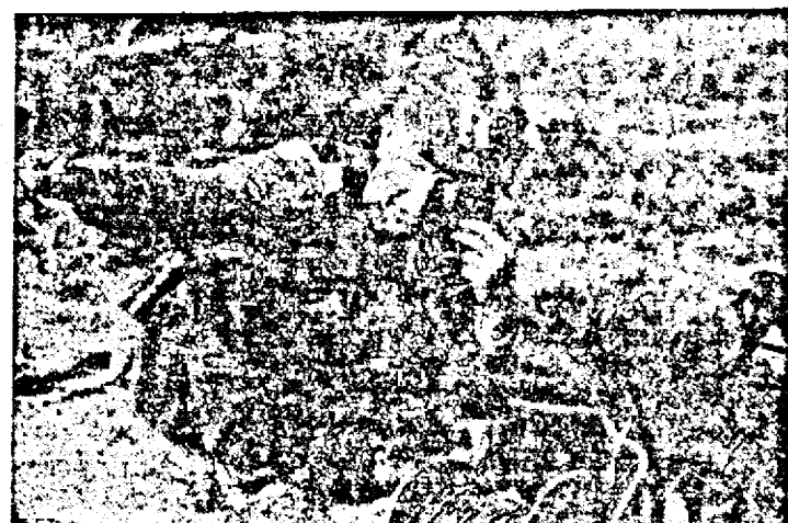
Un soldat finlandez la telefonul de campanie.