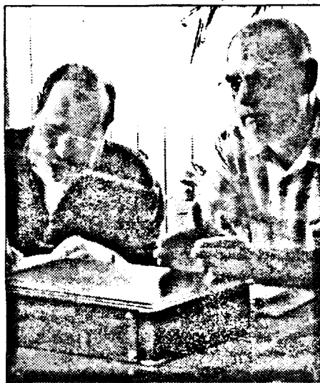
Sindicatul a obosit să înțeleagă și să aștepte

SIF Banat - Crișana, care deține 20% din acțiunile Aris, crede că există un dezinteres din partea APAPS-ului în ceea ce privește privatizarea societății arădene producătoare de strunguri. „Noi nu ne putem opune la o decizie a acționarului majoritar, n-avem instrumentul legal (referindu-se la abrogarea Ordonanței 229 cu privire la protecția acționarului minoritar - n. r.). Trebuie să se ia decizia de a vinde ARIS-ul fără datorii, altfel nu vine nimeni