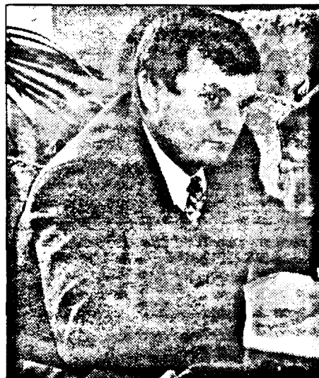
Directorul Horga mai speră în investitorul Weiler

Paralel cu privatizarea altor societăți arădene, statul român a încercat să-și vândă și pachetul de acțiuni deținut la ARIS. Nenumăratele tentative de a privatiza fabrica de strunguri au rămas fără rezultat. Și nu că n-ar fi existat potențiali cumpărători. În ultimii doi ani trei firme străine și-au manifestat interesul față de ARIS: Weiler din Germania, Wisconsin Tool Machines din SUA și Emco din Germania.