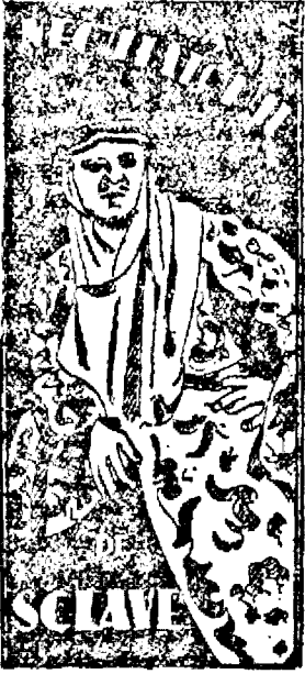
cu ANETA BACH

La 5, 7.30 și 9.30 cu prețuri regulate, la crele 3 intrare ge- neală lei 45