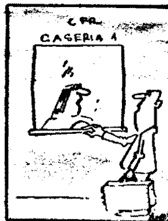
— Pînă la București. — Un bilet sau o garnitură!