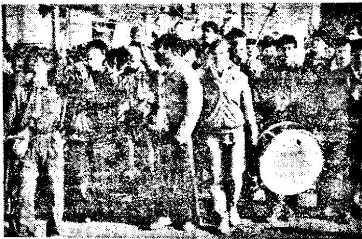
Immoasa galerie timișoreană cutreierînd străzile Aradului.