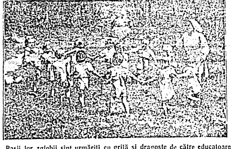
Pașii lor zgłobii sînt urmăriți cu grijă și dragoste de către educatoarea pricepută, în timp ce mamele care lucrează în întreprinderea „7 Noiembrie” se străduiesc să dea peste plan cît mai multe produse alimentare.