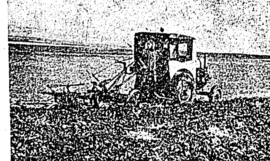
ÎN CLIȘEU: Tractoriștii de la S.M.T. Grossraschütz lucrează pe ogoarele cooperativei de producție agricolă din Skossa (R. D. Germană).

semințe selecționate care constituie o garanție pentru obținerea de recolte bogate. Prin grija partidului și guvernului, lucrătorii din gospodăriile agricole de stat, membrii cooperativei agricole de producție și țăranii muncitori cu gospodărie individuală sînt ajutați de stațiunile de mașini și tractoare, care le pun la dispoziție tractoarele și mașinile agricole necesare.