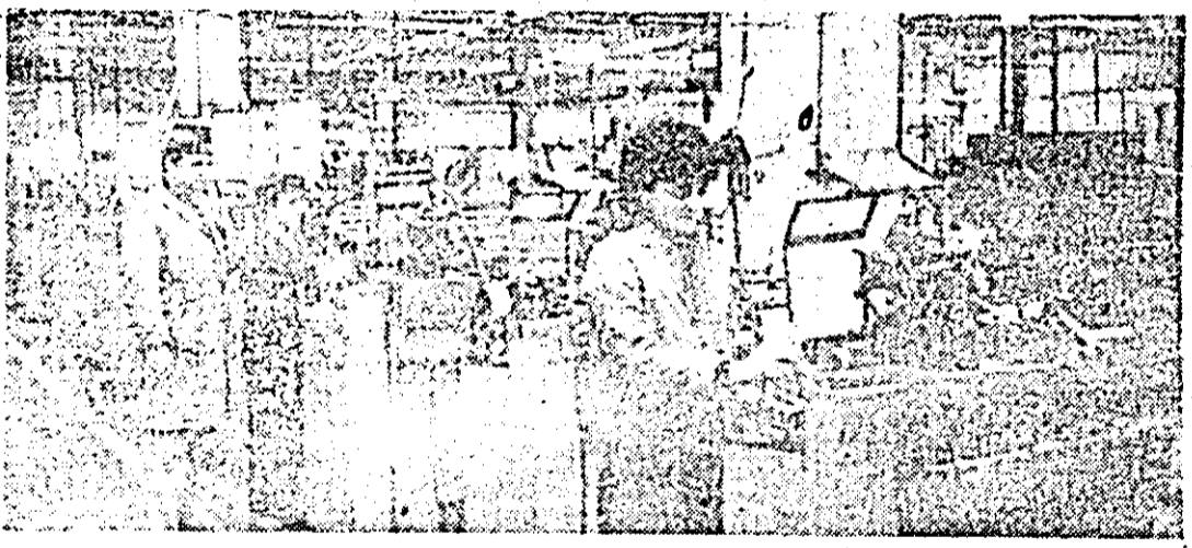
Intreprinderea de orologerie industrială. Aspect de muncă in secția strunguri automate.