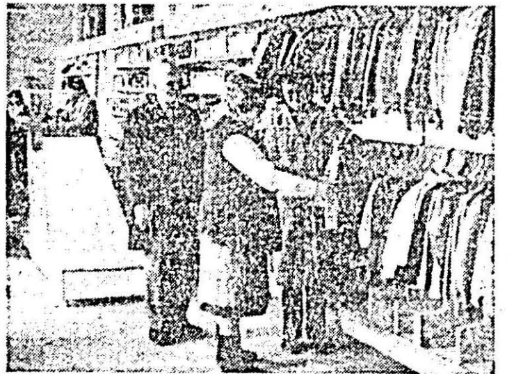
Aspect din magazinul „Prichindel”, unitate a I.C.S. mărfuri textile-încălțămintă deschisă în cartierul Aurel Vlaicu.