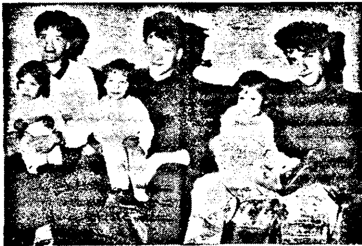
Tinara generatie din familiile Merlusca si Vlasiu.