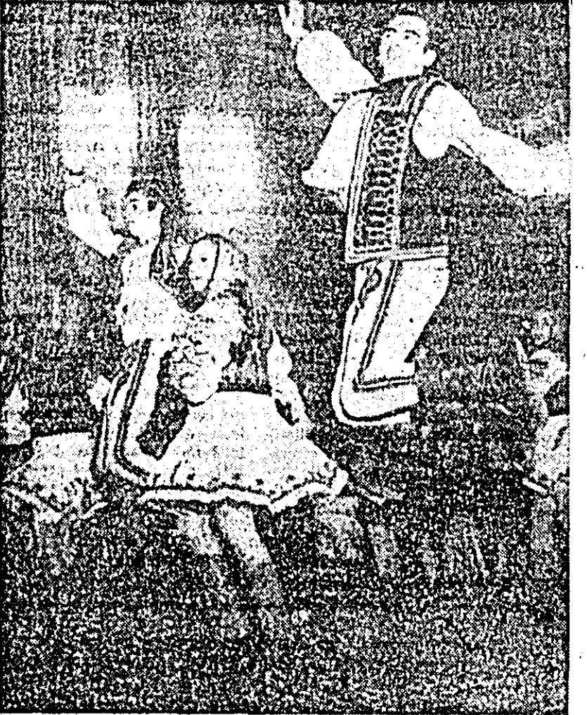
În virtutea dansului popular. Secvență din programul cultural artistic închinat frunțașilor în producție, care a avut loc sîmbătă pe scena Palatului cultural din Arad.

La ultima sedință a cercului literar de limbă slovacă din Nădlac, elevii liceului „George Coșbuc” au prezentat o deosebit de interesantă temă: halucele slovacă și Terhova. Dezbaterea a reliefat că Janosik — haluce slovac — poate fi pus alături de eroii noștri populari, Pintea și Toma Alimos.