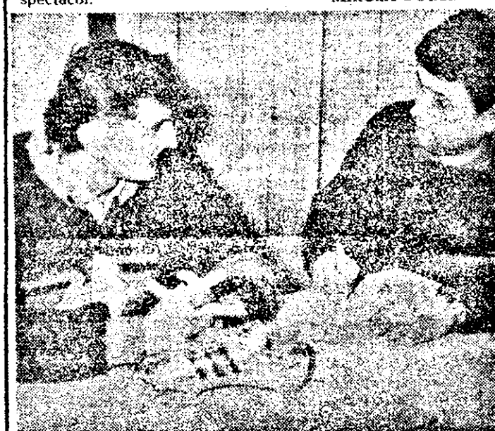
Discuția a pornit cu „Gheata de argint” pe masă...