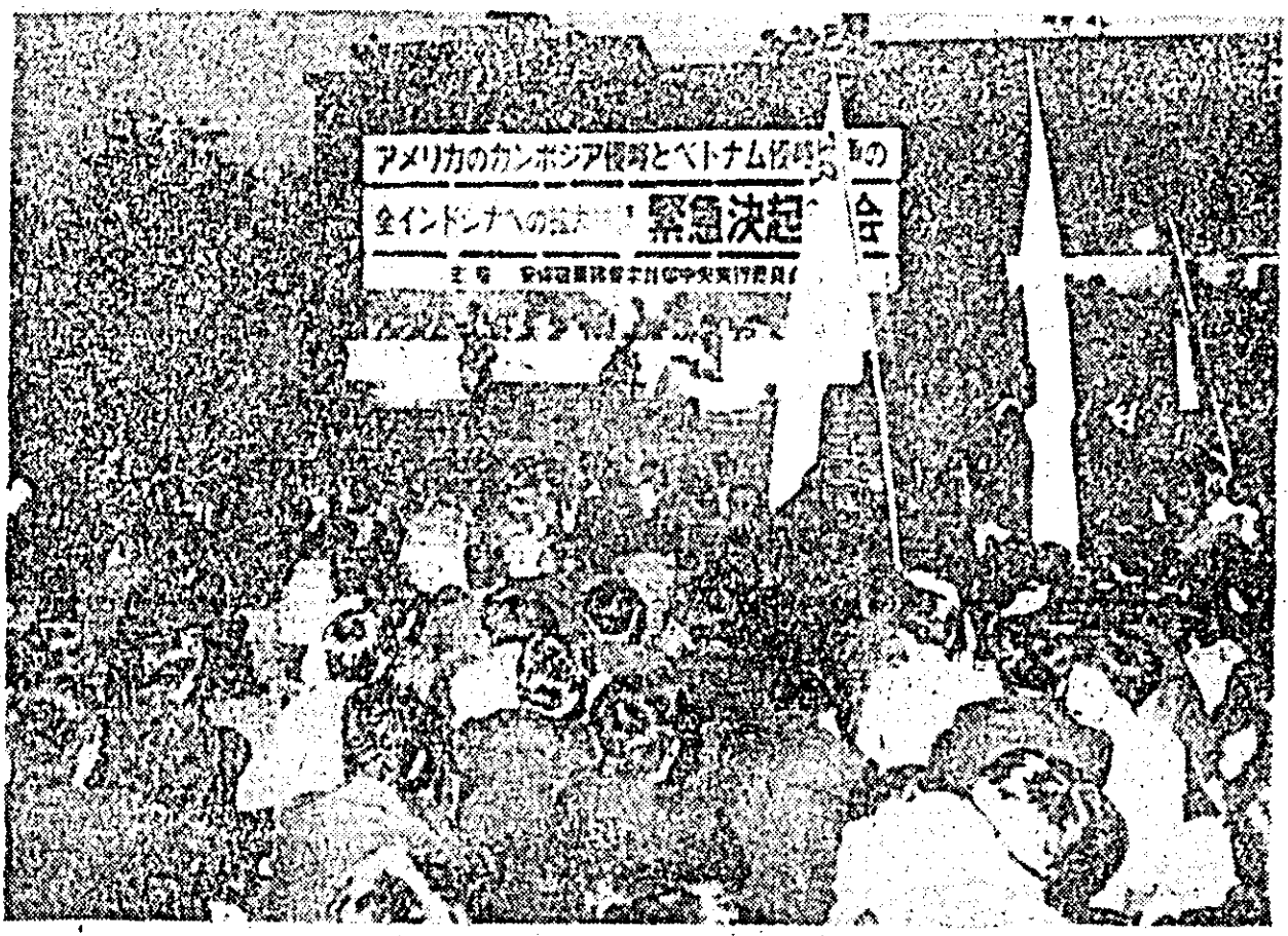
JAPONIA. 20.000 de muncitori, studenți, femei au luat parte la demonstrațiile de protest față de extinderea războiului din Indochina. ÎN FOTO: adunare de protest împotriva agresiunii americane în Indochina, la Tokio.

„APROXIMATIV 75 LA SUTA DIN NUMARUL DECESELOR de căror cauză este cancerul pulmonar ar putea fi evitate” dacă fumătorii ar renunța la țigărele în favoarea țigărilor de foi sau pipei — a afirmat medicul american John Turner în fața participanților la cel de al 10-lea Congres internațional al cancerului, ce se desfășoară în prezent la Houston. Pe baza observațiilor făcute asupra unui număr de 5.416 bolnavi, dr. Turner a ajuns la concluzia că procentul deceselor la fumătorii de pipă sau de țigări de foi este mai mic decât la persoanele care fumează țigărele. Dr. Turner a remarcat totodată că din 118 pacienți ai căror deces s-a datorat cancerului pulmonar, numai doi erau nefumători.