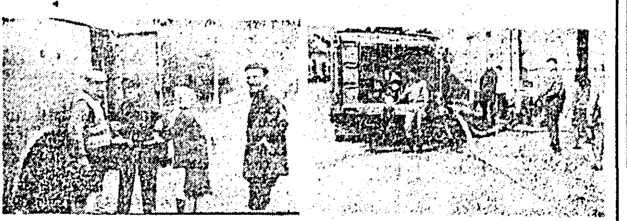
Din cisternele pompierilor populația Lipovei primește apă potabilă. Se lucrează din plin la evacuarea apelor din subsolurile clădirilor orașului.

să lucreze din plin. Vom dubla de asemenea producția de balast la carierele de la Răpșig și Bocșig. Celelalte secții lucrează la realizarea unor cantități sporite de bunuri de larg consum. În încheiere aș vrea să rețineți că salariiții întreprinderilor noastre depun eforturi sporite și-și aduc o contribuție cit mai substanțială la recuperarea pierderilor cauzate de revărsarea a apelor.