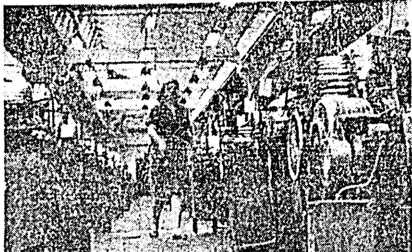
În secția țesătorie automată a unității „30 Decembrie” a Combinatului textil, munca se desfășoară din plin.

Tot în sprijinul sinistraților membrii cooperativei au hotărît să suplimenteze planul anual de producție cu 500 perechi de încălțăminte fiind un colectiv mic fapta se amplifică la proporții demne de admirat, care vor solicita eforturi deosebite. În mai puțin de o săptămînă acest mînaunchi de oameni va trimite familiilor care și-au pierdut bunurile materiale, 100 de perechi încălțăminte lucrată din materiale economisite și manoperă nepătită. Donînd o zi din salariul lunar cooperatorii de la „Muncitorul plelar” depun suma de peste 20.000 lei în impresionantul cont al solidarității umane.