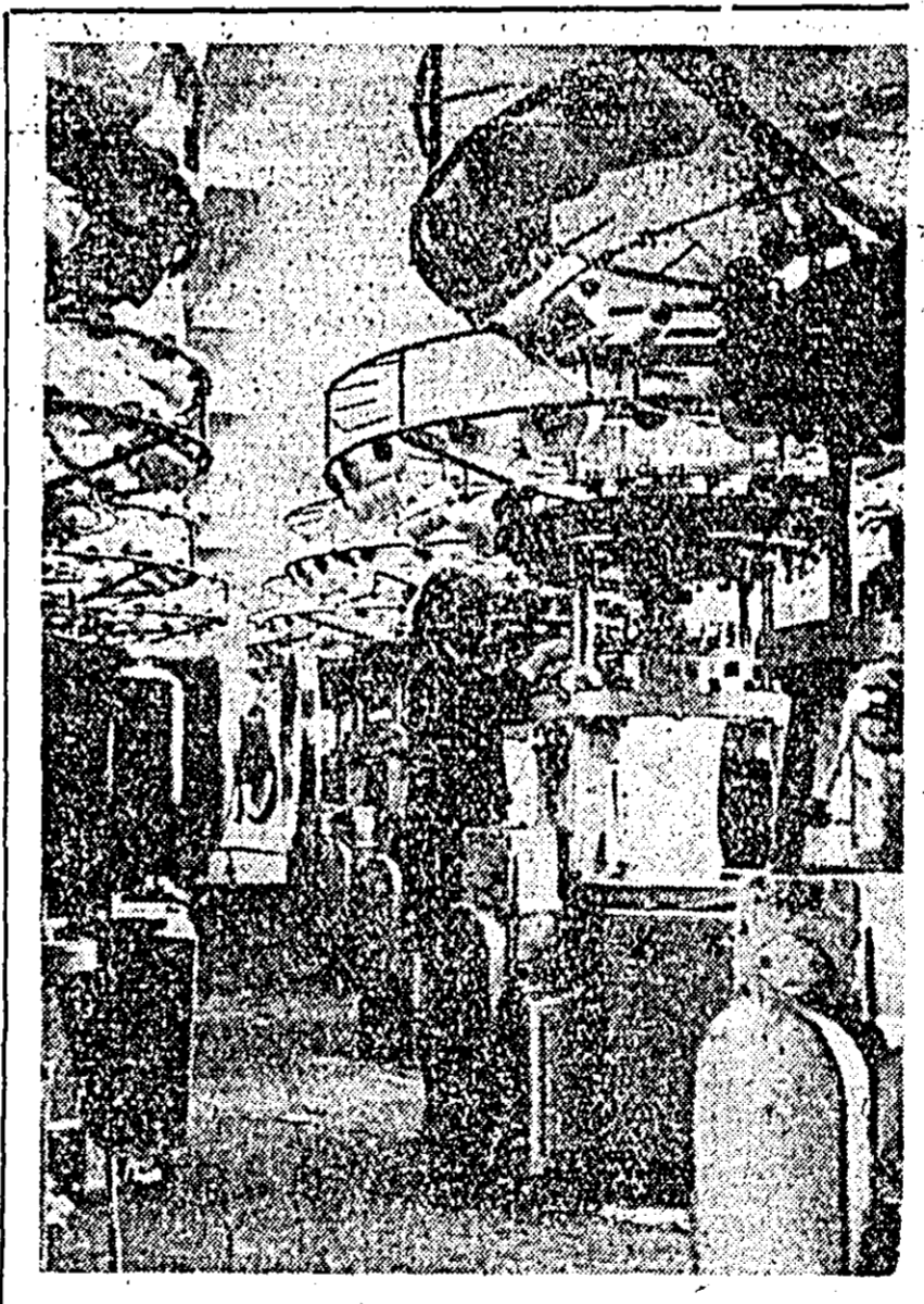
Vedere din secția interloc a fabricii „Tricolor roșu”.