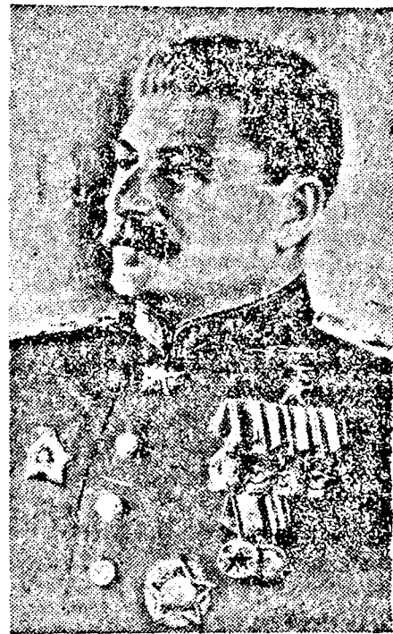
J. V. SZTÁLIN

Sztálin elvtárs „ANARHIZMUS, VAGY SZOCIALIZMUS?” című munkája 1906—1907-ben a gruz forradalmi sajtóban jelent meg először. A munka megírására az szolgáltatót közvetlen okot, hogy az