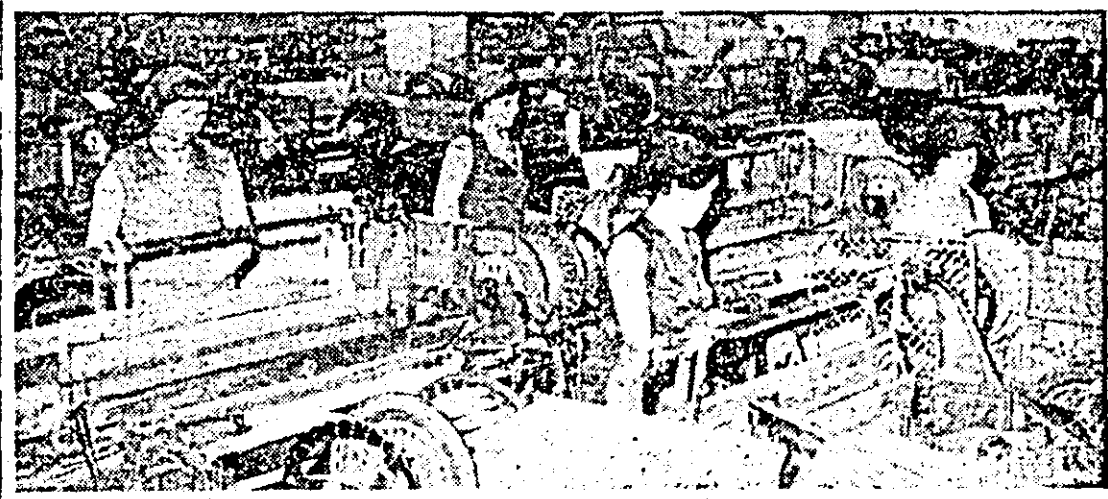
Instantaneu de muncă din secția țesătorie II a Întreprinderii textile.