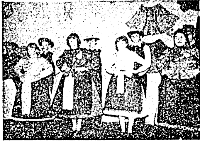
Secvența de la parada portului popular german din comuna Vladimirescu.

Intilnele. 57 de costume populare românești, germane, maghiare și slovace au fost prezentate duminică pe scena căminului cultural într-o impresionantă paradă a portului popular susținută de elevii de la școala generală și copiii de la grădinița din Fintilnele. Precedată de expunerea „Păstrarea tradiției folclorice — preocupare permanentă în activitatea P.C.R.”, acțiunea cultural-artistică la care ne referim și