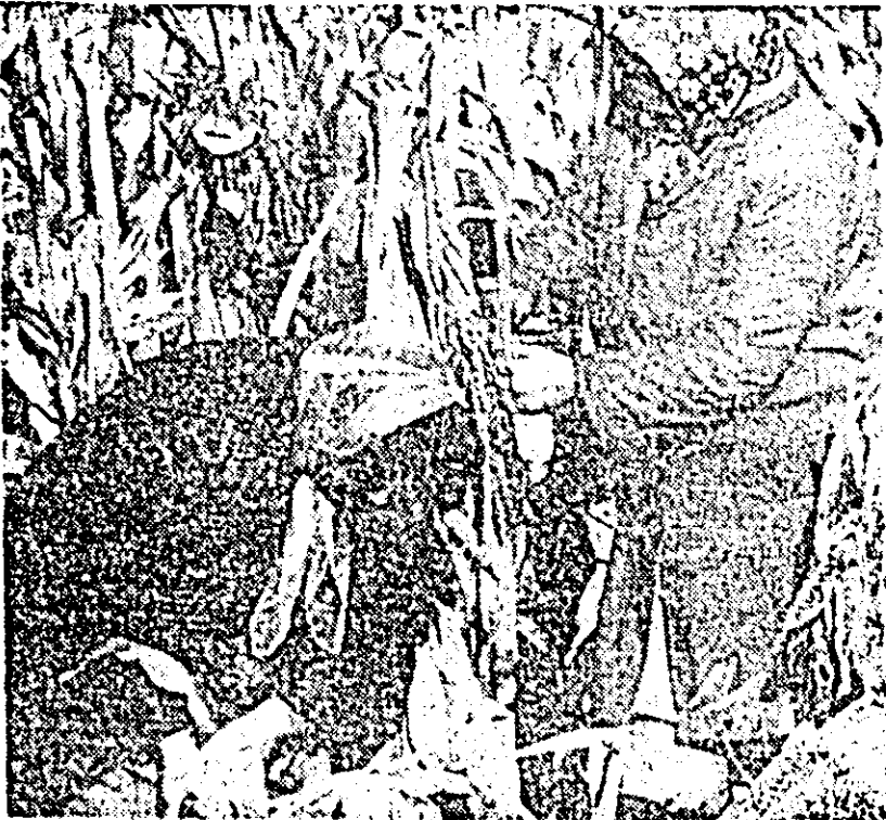
Cules de porumb la Turau