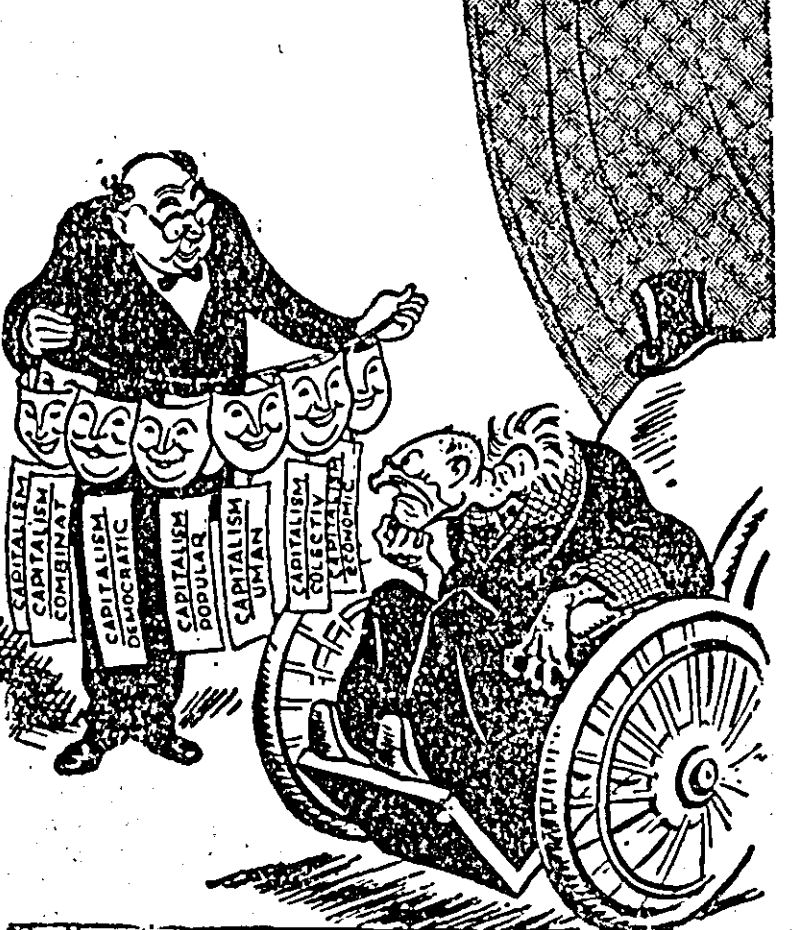
ALTE MAȘTI, ACEAȘI PIESA...

Intregul aparat propagandistic al marelui capital a pornit o adevărată „ofensivă” de înfrumusețare a noțiunii de „capitalism”, adăugîndu-i-se epitetul de „popular”, „democratic”, „uman” etc. (Ziarele)