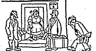
— Am venit, șiști cu bonul... — Abia terminal cu unul și-acum d-ta? Ia, vezi, să nu... Aha! Uite! și pe-al treilea..