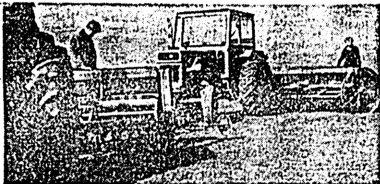
Pe ogoarele cooperativei agricole „Avântul” din Pecica, fruntașii anul acesta la producția de grâu, se pun bazele unei noi recolte la această cultură.