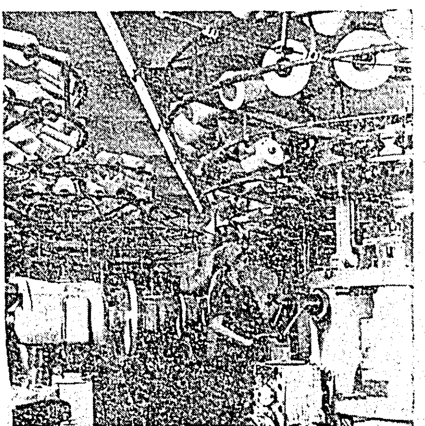
Secția de tricot de la Întreprinderea 'Tricoul roșu' își aduce o contribuție substanțială la realizarea produselor întreprinderii...