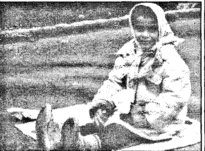
... Nefericită, a nimănui, își dorește ca și atâția alții în aceeași situație, un acoperiș deasupra capului.

Moș Crăciun”, care își sorbea fiul din ochi: