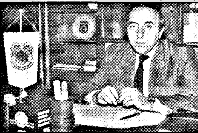
Am avut cazuri dificile pe probleme economice cu implicații și cu intervenții