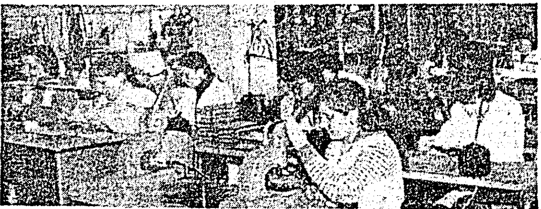
Întreprinderea de vagoane „Victoria”. Aspect de muncă din secția subasamblare.