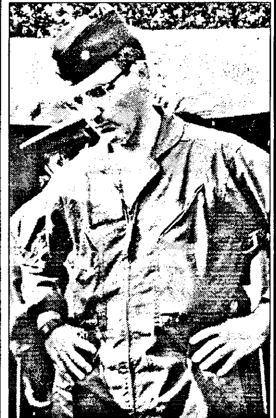
Atașatul militar al SUA pare a spune: ar fi bine să primim România în NATO!