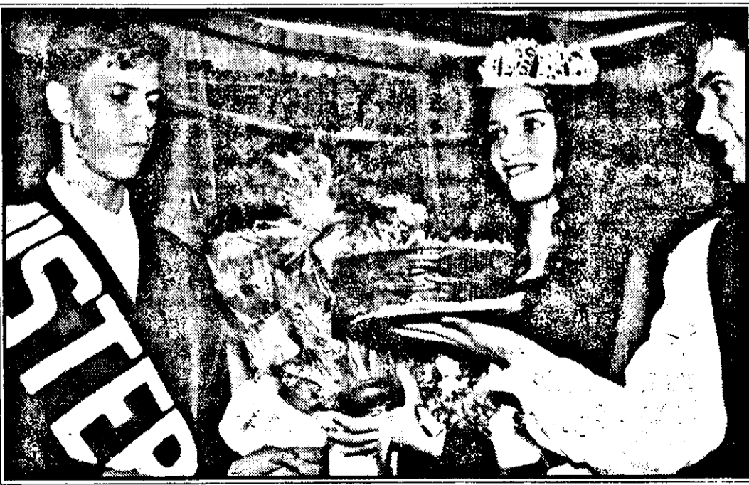
E vremea balurilor... Miss și Mister Boboc '96 „Aurel Vlaicu”.

Televiziunea Română, programul 2, prezintă vineri, 11 octombrie a.c., orele 13, emisiunea studioului teritorial Timișoara „La izvoare... cu Florica Mureșan pe Valea Teuzului la Mișca-Arad”. Realizator Tiberiu Ceia.