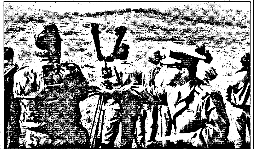
Ținta aflată în planul depărtat (liziera pădurii) a fost lovită.

...Când s-a lansat prima rachetă din instalația portativă, m-au apucat fiorii amintindu-mi