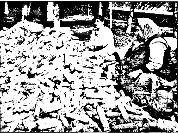
De mulți ani, producătorii agricoli arădeni n-au mai obținut asemenea recolte de porumb.