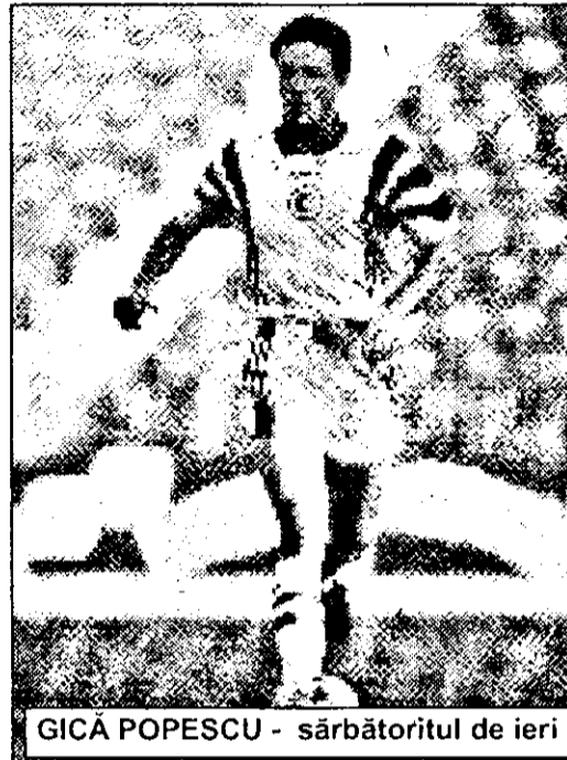
GICĂ POPESCU - sărbătoritul de ieri

pricepe mai bine ca la fotbal - cât și români, pot înscrie, însă Stelea și bara din stânga porții lui B. Kristinsson, nu sunt de-acord ca mingea să intre în plasă.