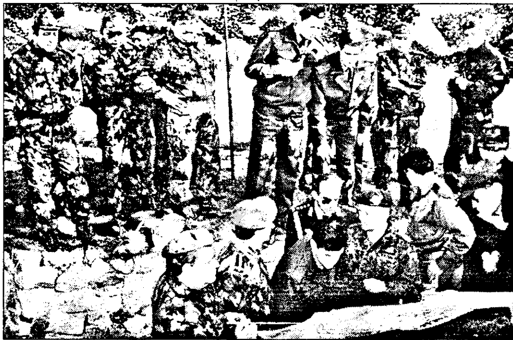
Atașai militari acreditați în România studiază harta topografică a câmpului de luptă.

Atât „nordistii” cât și „sudistii” sunt copii, care a trebuit să poarte un nume. La aplicațiile tactice ei sunt adversari, dar pregătirea lor este unică. Fiecare a avut de învățat, fiecare a transpirat, fiecare a luptat, încheind etapa de