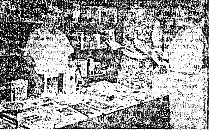
Aspect din noua librărie pentru școlarii deschisă recent în strada Mărășeștilor din municipiul nostru.