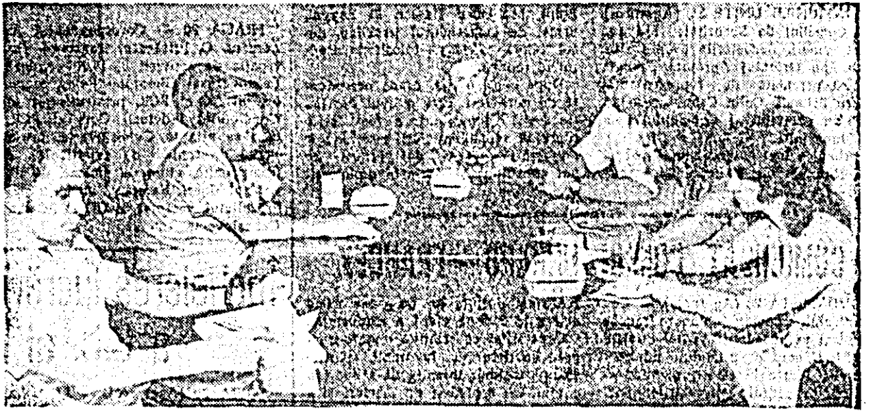
Aspect de la discuțiile purtate la masa rotundă.

(NICOLAE CEAUȘESCU. Expunere la Plenara CC al PCR din 3-5 noiembrie 1971)