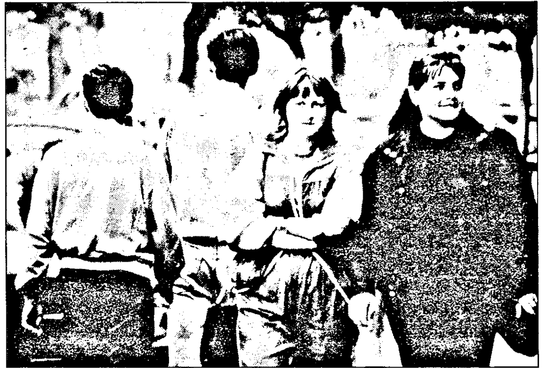
Două pe față, doi pe dos ...