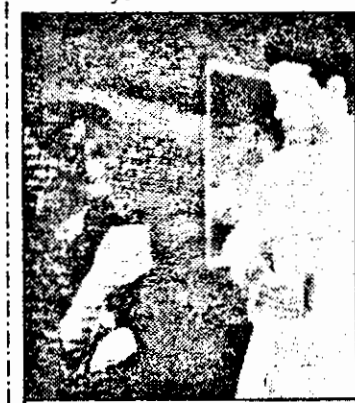
SAT 1 - 21,15 Hello, nene doctor!-s.germ.

7,00-21,00 Desene animate (s) Astăzi: După gratii 21,00 Marea casă (f.1930) de Wallace Beery, Robert Montgomery