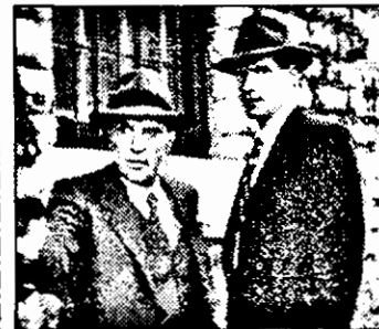
PRO 7 - 0,05 Eliot Ness - f.avent Anglia 1989

6,30 Magazin matinal 10,05 California-s.am. 11,00 Bogazi și frumoși-s.am.