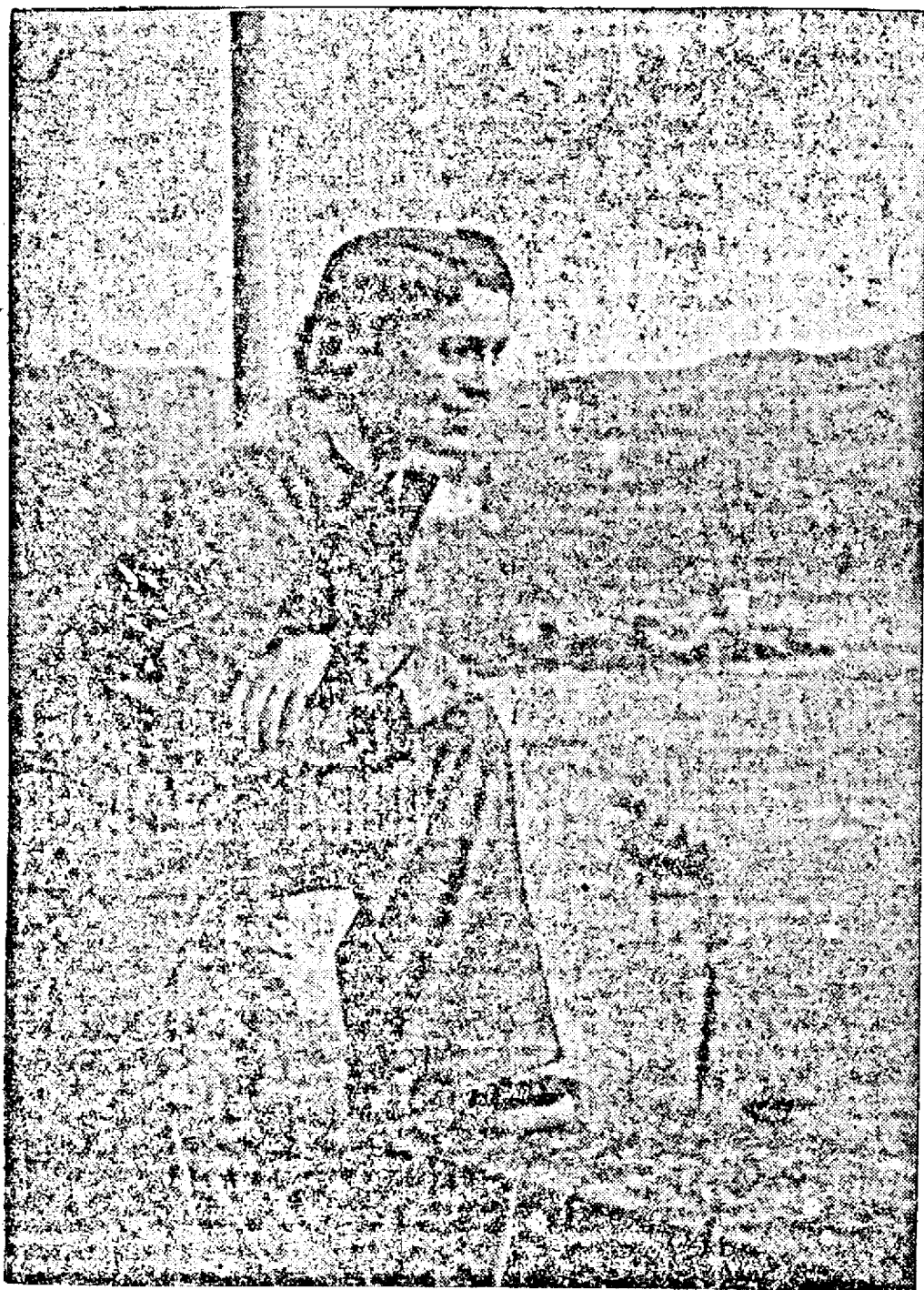
Fascinantă vedetă a casei „Tobis”: JE NNY JUGO, care va reapare alături de Gustav Fröhlich într-o puternică dramă sentimentală.