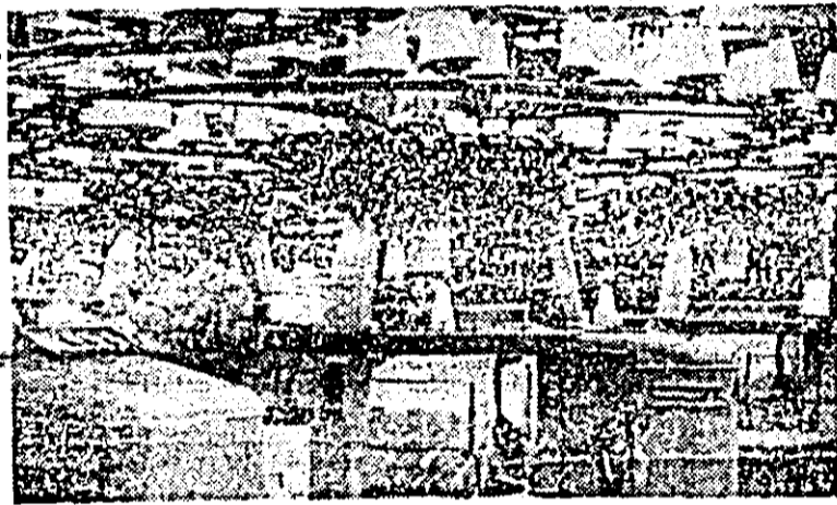
Aspect de la întreprinderea „Tricolor roșu”.