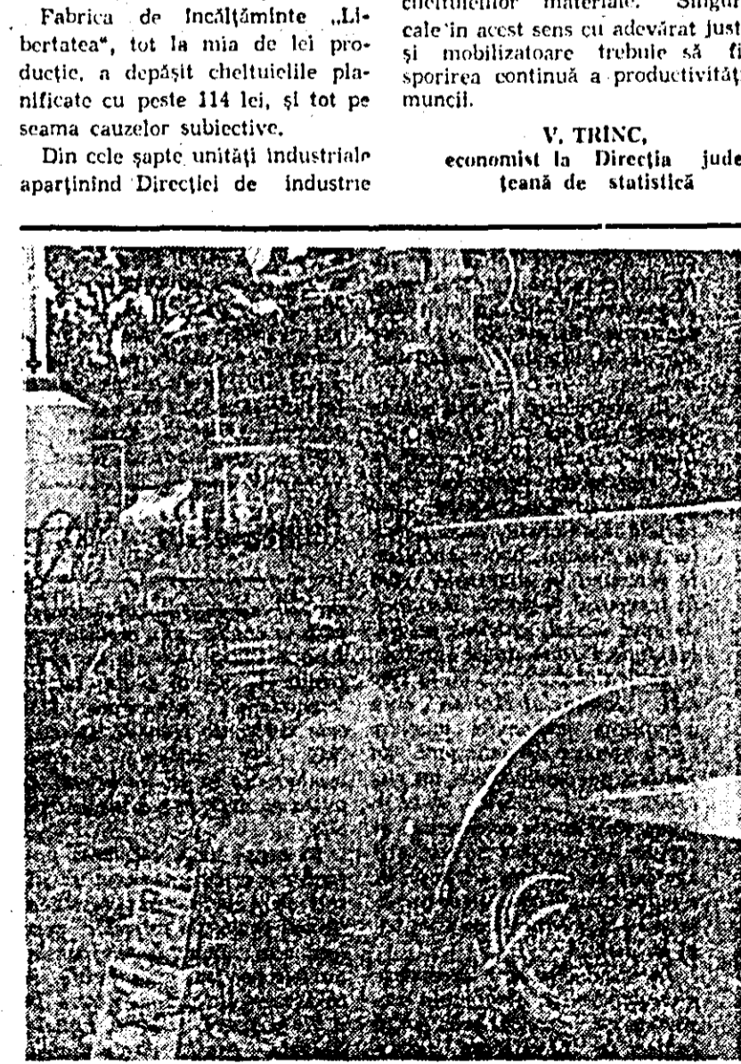
Utilaje moderne, cu înalt grad de tehnicitate — creație a colectivului de muncitori, ingineri și tehnicieni de la Uzina de reparații.